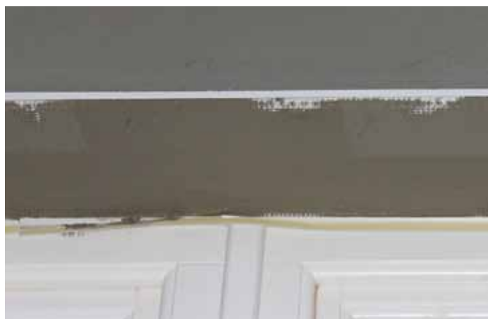
Ugrađena lajsna sa okapnicom / 2