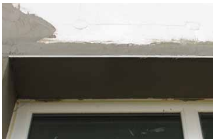
Ugrađena lajsna sa okapnicom / 1

i oštećenje tj. pucanje fasade. Takođe, mehanički štiti sve ivice na kojima je ugrađena, a da su pri tome sve ivice idealno ravne. Staklena mreža koja se nalazi na PVC ugaonoj lajsni mora da zadovolji sve kvalitativne uslove kao i staklena mreža koja se koristi za armiranje termoizolacionog fasadnog sistema.