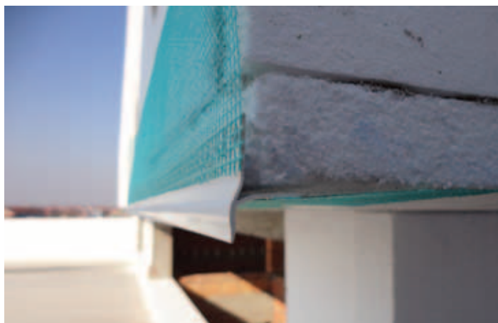
Ugražena PVC lajsna sa okapnicom i staklenom mrežom