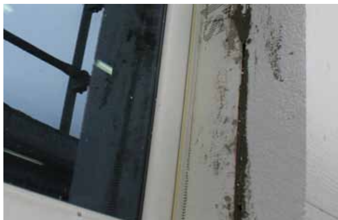
Izolovanje prostora između prozora i fasade iza mrežice kontakt lajsne / 2