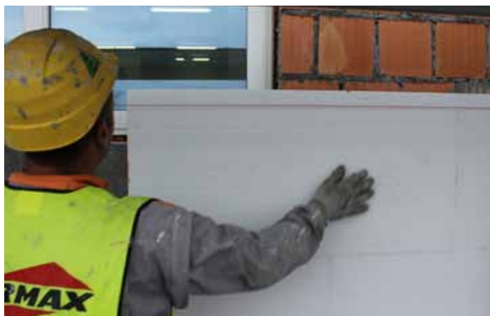
Pravilna montaža termoizolacione ploče