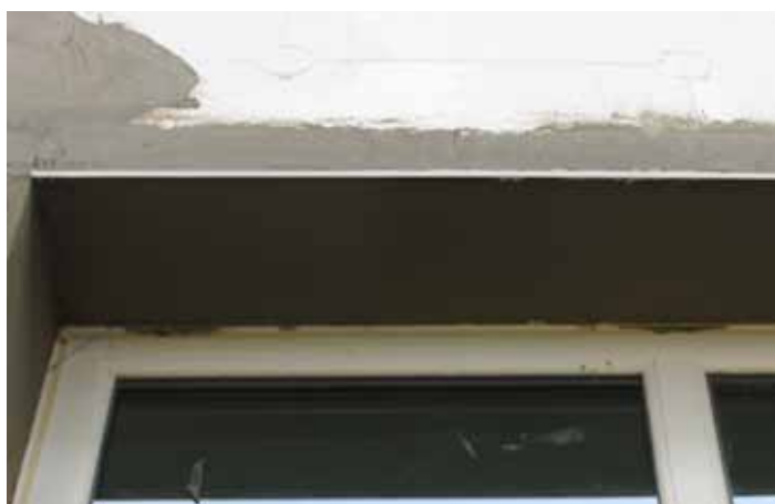
Kombinacija lajsne sa okapnicom i kontakt lajsne