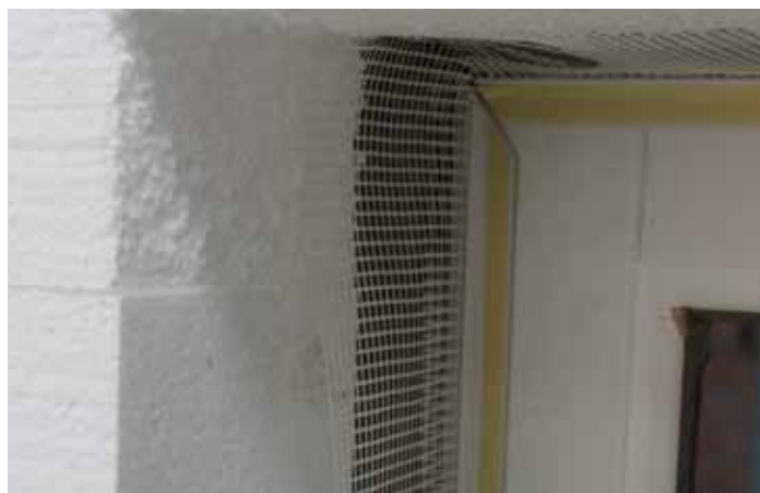
Pravilna obrada ugla prozora kontakt lajsnom i stiroporom