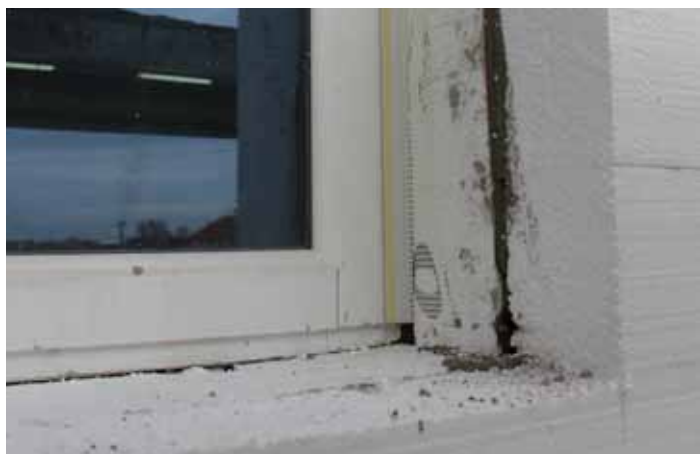
Izolovanje prostora između prozora i fasade iza mrežice kontakt lajsne / 1

konstrukcijom proizvoda. Omogućuju estetski savršenu završnu obradu. Deo profila koji se ne prekriva završnim materijalima se posle završenog rada jednostavno i brzo otklanja, ostavljajući idealno ranu ivicu. Staklena mreža olakšava i znatno ubrzava završnu obradu fasada.